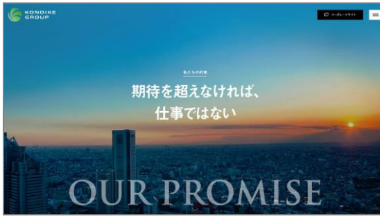
トップページには「私たちの約束」を掲示