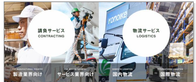
幅広い事業領域を、個別に説明