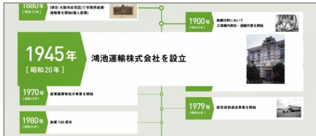
140年の歴史をわかりやすく紹介

KONOIKE グループの概要を紹介する動画を、約3年ぶりに全面リニューアル。「私たちのブランド」、「歴史」、「事業紹介」を網羅、映像とテロップでわかりやすくご紹介しています。KONOIKE グループコーポレートサイト( https://www.konoike.net/company/library/ )と YouTube の「KONOIKE グループチャンネル」( https://www.youtube.com/channel/UCwARft9sMIRvgMO5INC1fSQ )で配信しています。英語版も近日公開予定。