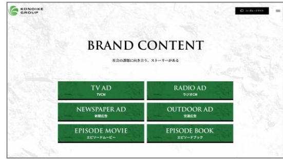
宣伝素材やエピソードムービーを一覧で紹介