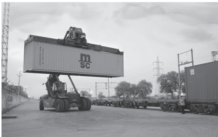
インドで展開中の鉄道コンテナ輸送事業

スまで、広範な業務を請け負っている。 同社の強みは、お客様のニーズに応じて請負から物流まで一貫したサービスを、高品質かつ安全に提供できる「現場力」にある。お客様からの信頼は厚い。