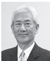
代表取締役兼社長執行役員

【私たちの使命】（企業理念） 「人」と「絆」を大切に、社会の基盤を革新し、 新たな価値を創造します