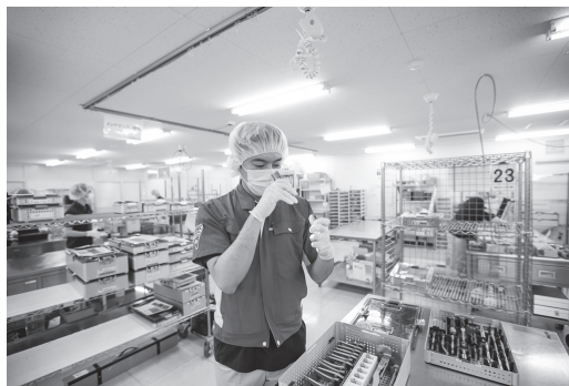
医療業界向けサービス

物流サービスとならぶ事業の柱が請負サービス。鉄鋼、食品などの製造業や医療、空港などサービス業のお客様から、本業周辺のさまざまな業務を請け負う。製造業では原料受け入れから生産・保管・配送までの各工程に関わる。医療業界では、医療機関や医療関連メーカー、卸企業などを対象にした専門一貫物流サービスはもちろん、医療機器の洗浄・滅菌代行処理など高度専門技術を要するものまで幅広いサービスを提供。さらに空港業界では、国内の主要空港において航空貨物や手荷物の取り扱いから、航空機誘導や機内清掃、空港内のカウンター業務などの旅客サービス